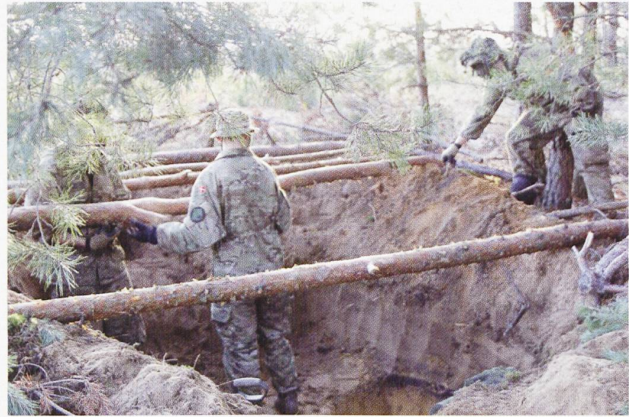
Ci-dessus : Préparation d'un poste d'observation par des éclaireurs danois.

Ci-dessous : Malgré leur taille modeste, les armées belge (2 illustrations) et néerlandaise se sont dotées d'un bataillon ISTAR servant à la recherche de renseignement mais également au ciblage d'objectifs au profit de l'artillerie, de l'aviation ou de la marine.