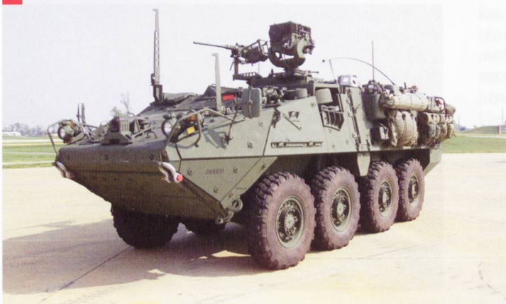
Le M1127 Stryker Reconnaissance Vehicle (RV) pèse 16,47 tonnes. Il est armé d'une mitrailleuse de 12,7 mm ou d'un lance-grenade de 40 mm télé-opéré. Son autonomie est d'environ 500 km.