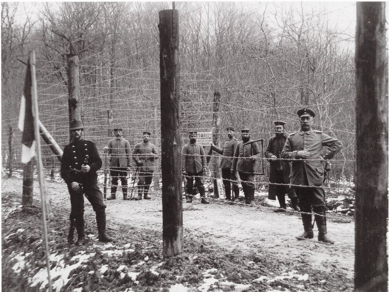
La barrière allemande à la frontière du Largin.

En arrivant dans la position, on ressent une émotion, une sorte de malaise. On est là, debout, comme protégé par le drapeau rouge à croix blanche, observé par des centaines d'yeux invisibles. On veille, on guette l'indice qui annoncerait une attaque contre le pays, ce qui n'empêche pas d'avoir des contacts avec les voisins français et allemands, de faire avec eux de menus échanges. On doit parfois éprouver un sentiment d'impuissance, quand les artileries belligérantes se déchaînent. Tous les citoyens-soldats souhaitent passer dans cet avant-poste, cette première ligne où ils se trouveront au contact des soldats des deux camps, qui se battent, souffrent et subissent les