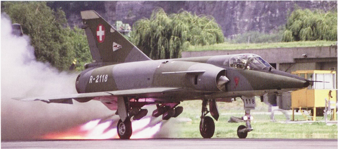
Avec le retrait des Mirage III RS , l'exploration aérienne ne repose désormais plus que sur les drones ADS-95 aux capacités limitées.

ne nous fait pas entièrement passer à la génération suivante. Pour des raisons financières, nous ne pouvons pas aujourd'hui investir directement dans la génération la plus récente. D'autre part, l'acquisition du Gripen nous donne une chance de combler au moins partiellement nos lacunes dans les domaines du « combat terrestre » et de l'« exploration ». Dès l'introduction du Gripen , le service de police aérienne pourra être totalement assuré, en liaison étroite avec les moyens existants (F/A-18). Les deux autres capacités doivent en un premier temps être retravaillées, ce qui peut prendre des années. Bien entendu, la question de la nécessité de ces deux capacités « tombées dans l'oubli » dans le contexte actuel de la politique de sécurité se pose. Ces capacités doivent être reconstruites sur un plan simplement qualitatif, afin de permettre à l'armée de maîtriser les processus et de disposer des connaissances nécessaires pour pouvoir, le cas échéant, se développer à partir de ce noyau sur un plan quantitatif. Le combat terrestre et l'exploration aérienne sont alors surtout utiles à l'ensemble de l'armée. Il faut encore ajouter un point décisif : dans le cas d'une situation de crise, il s'agit de proposer aux autorités politiques une palette d'actions aussi large que possible.