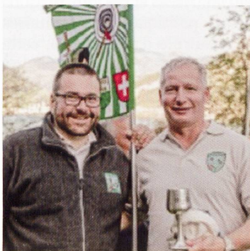
Les tireurs vaudois, en compagnie du Chef de l'Armée, le cdt C André Blattmann.