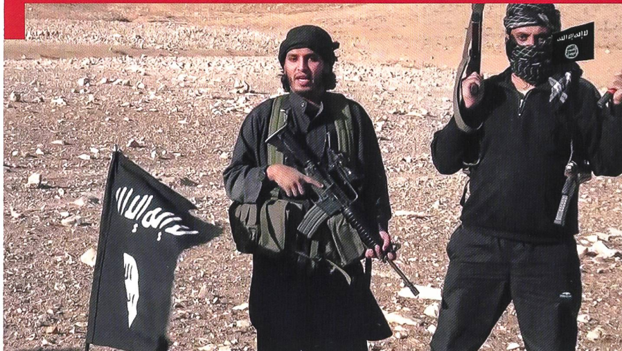
Ci-contre et pages suivantes : scènes de « propagande » de l'Etat islamique, montrant ses armes, sa force et aussi sa cruauté. Pages suivantes : Les crimes de guerre, attestés par de telles images, sont légions.