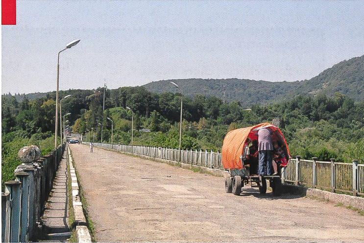
Le pont d'Inguri constitue le seul point de passage motorisé.