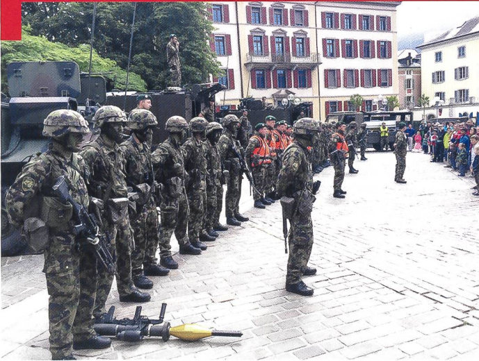
Bat car 1