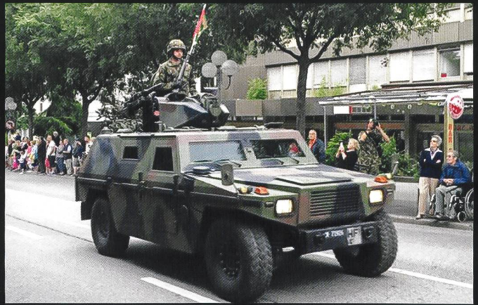
De haut en bas : véhicule d'exploration 93/97 Eagle; char de grenadiers à roues 93 Piranha; et GMTF. En bas : Pas de mobilité ni de capacité à durer sans logistique.