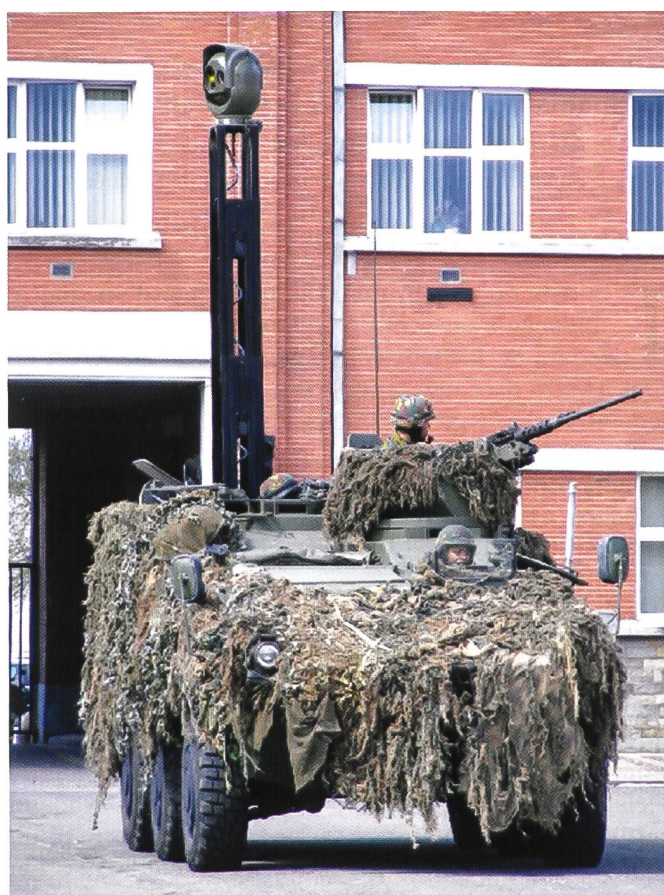
Ci-dessus : le Pandur 6x6 belge.