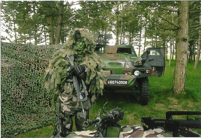
Matériel employé par le 2 e régiment de hussards (2 e RH) français.

Pandur dotés de nouveaux capteurs, et une compagnie d'exploration équipée de radars de surveillance montés sur Unimog et sur M-113. Acquis à l'origine comme transports de troupe, les Pandur ont été modifiés en véhicules d'exploration grâce au montage de nouveaux équipements électroniques, comme une boule optronique de type Margot 5000 , intégrant différents capteurs, dont une caméra thermique de nouvelle génération et une voie optique diurne facilitant l'observation à plus de 10 km de distance. Le bataillon dispose d'une capacité d'analyse du renseignement et peut disposer d'informations provenant de sources externes, comme le groupe des forces spéciales (SFG), les nacelles de reconnaissance des F-16 et les drones B- Hunter de la composante Air, les images recueillies par les hélicoptères Agusta A109, voire même d'images satellitaires, dans le cadre de l'accord que la Belgique a conclu avec la France pour utiliser les capacités du satellite Hélios 2 .