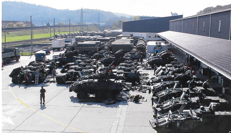
Le bat expl 1 reçoit ses véhicules au centre logistique de Hinswil, 2014. Cet article est paru dans le Bulletin de l'Association des officiers de renseignement N° 3/2015.