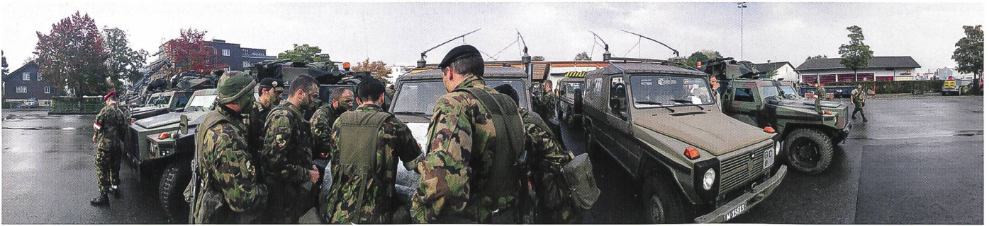
Donnée d'ordres du cdt cp chass chars 1/2.

convois, la sûreté sectorielle, la surveillance de secteur et l'exploration d'objectifs.