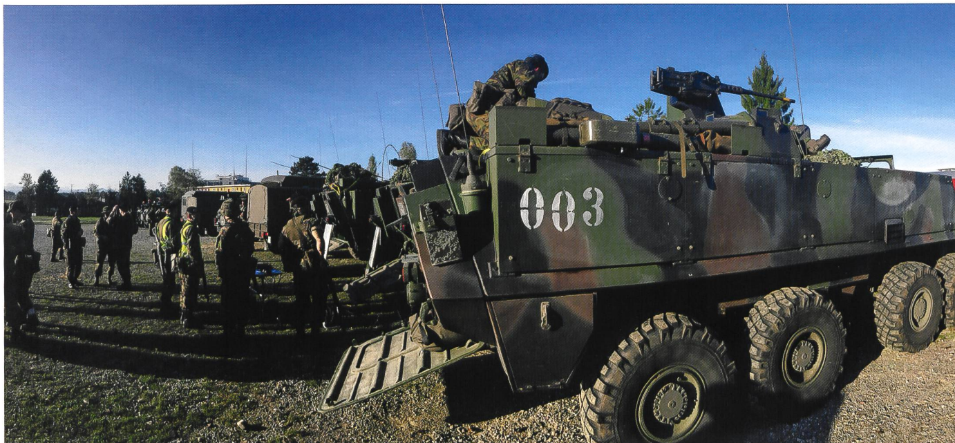
Le char de commandement 003 contient les systèmes de conduite des feux intégrés de l'artillerie (INTAFF).

Les moyens actuels permettent à chaque véhicule ( Eagle et Piranha ) de servir de « capteur » autonome, en patrouille (1-2) ou en section (5). La mission et l'intention déterminent à partir de quelle ligne et où l'effort principal de retardement doit être effectué, par l'engagement des chasseurs de chars qui sont en définitive les seuls moyens aptes au combat. Ceux-ci sont le plus efficaces en opérant à partir de secteurs reconnus et de positions camouflées. Ils engagent le combat entre 2'000 et 3'700 mètres, en priorité contre des buts rentables : véhicules de commandement ou de transmissions (C2), engins spéciaux du génie (ponts, systèmes de minage ou de déminage), moyens d'appui de feu, etc. On peut noter encore que les chasseurs de chars du bataillon d'exploration peuvent constituer des plates-formes d'observation efficaces dans le cadre de la surveillance de secteurs et que c'est dans cette optique que la doctrine actuelle tend à les engager.