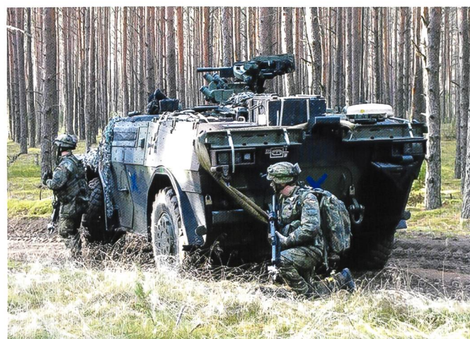
Ci-dessous : Un Fennek néerlandais, engagé dans un exercice combiné en Estonie (SABER JUNCTION), automne 2014.