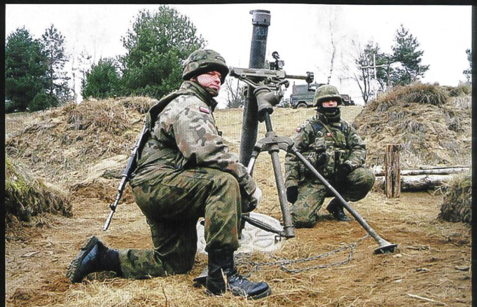
Un mortier de 60 mm LM-60D prêt au tir.