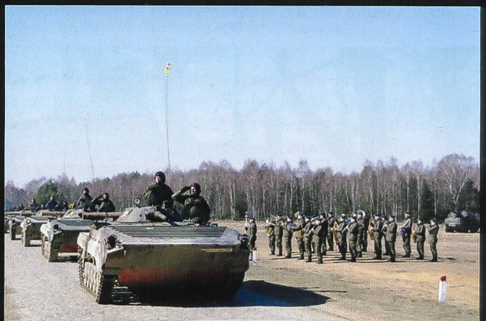
Les forces armées polonaises alignent plus d'un millier de BWP-1, version produite localement du BMP-1 d'origine soviétique.