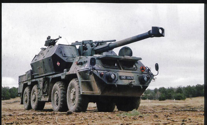
L'obusier de 152 mm L37 Dana (M-77) dont 111 exemplaires sont en service en Pologne.