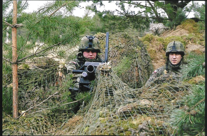
Mise en batterie d'un lance-grenades automatique LG40.