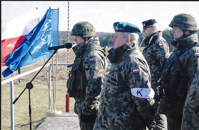
Le directeur de l'exercice, portant un brassard « K » ( Kierownik ) à la prise d'armes de la fin de l'exercice.