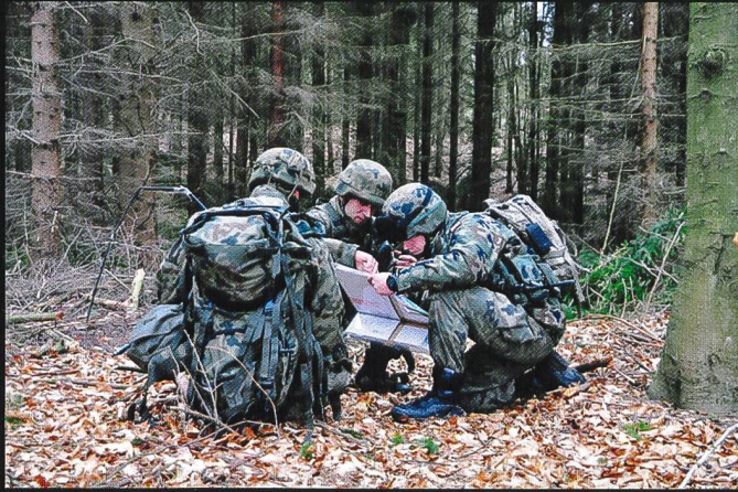
Orientation dans le terrain. La sûreté rapprochée dans le secteur d'attente est mise en place.