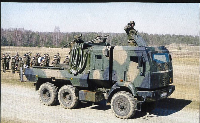
Une unité de feu équipée de MANPADS PZR Grom .