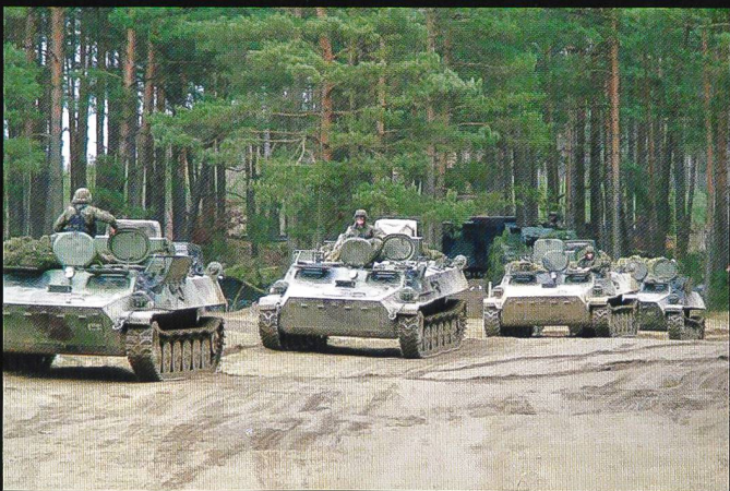
Une colonne de véhicules transport de troupes MT-LB. Ces engins sont employés pour transporter des spécialistes à l'instar des sapeurs de chars, ou pour tracter des armes lourdes. 55 sont en service.