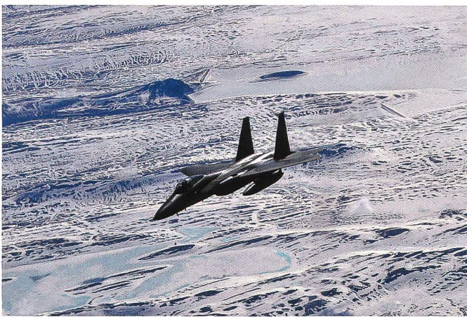
22 avril 2015 : un F-15C Eagle du 871 e Air Expeditionary Squadron assure la « police aérienne » au-dessus de l'Islande.

4 Sukhoi 24 Fencer – un bombardier similaire au F-111 américain et vieux de bientôt 35 ans. A cela s'ajoutent jusqu'à 17 Sukhoi 25 Frogfoot – un avion d'appui aérien rapproché dont le bilan militaire a été plutôt mitigé dans le Caucase et même au-dessus de l'Ukraine ; il est possible que ces appareils ne soient pas voués à être pilotés par des militaires russes mais, comme par le passé, ont été acheminés via la Mer Noire pour renforcer l'armée syrienne exsangue.