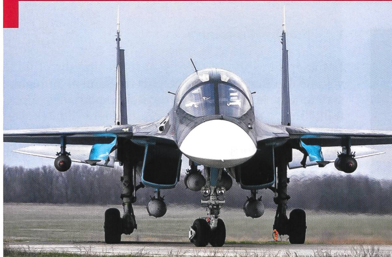
Le Sukhoi 34 est le premier appareil entré en service dans les forces aériennes de front russes (VVS), développé après la chute du Mur de Berlin.