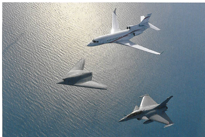
Le démonstrateur français nEUROn en compagnie d'un Rafale et d'un jet d'affaire Falcon .

Une fois cette haie passée, le projet sera déjà sur de meilleurs rails. Il n'est toutefois pas certain que le syndrome de concurrence Rafale /Eurofighter soit totalement écarté. EADS pourrait bien revenir à l'assaut