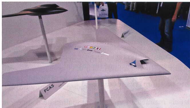
Le drone Taranis britannique aux lignes très semblables.

Le projet franco-britannique est plus qu'un drone armé. Il sera un véritable engin capable de pénétrer des défenses adverses, d'emporter des armes lourdes et de frapper avec précision contre des buts durcis.