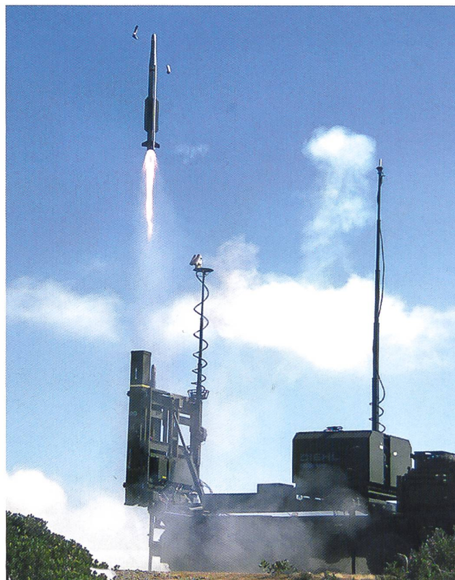
Iris-T SL de la firme Diehl, CAMM de la firme MBDA UK et lance-missile

importantes demeurent, telles qu'elles sont aujourd'hui vécues avec TRIO :