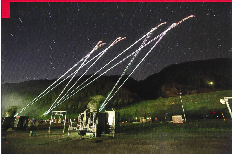
Unité de feu de la défense contre avions moyenne (DCA M) lors d'un tir de nuit. Traduction: Cap Julien Grand.