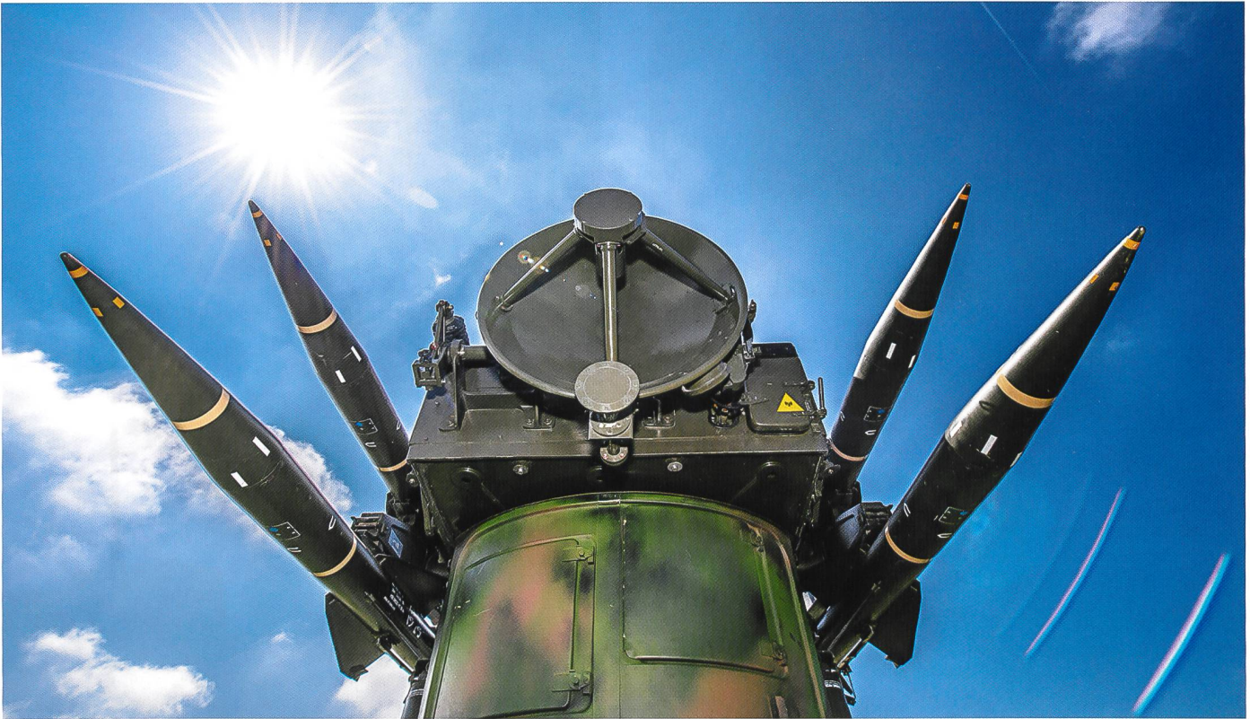
Quatre engins guidés par lanceur représentent la puissance de feu d'une unité de feu Rapier .