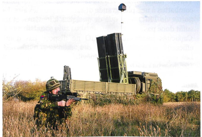
Le programme Future Light Anti-Aircraft Defence System (Land) ou FLAADS(L) britannique vise à remplacer le Rapier en Grande-Bretagne. L'idée est de déployer des systèmes en grand nombre et de manière décentralisée, à l'instar de ces camions. Il était également prévu à l'origine de pouvoir débarquer le système à terre.

En conséquence, l'engagement de la défense contre avions se déroule en grande partie de manière autonome et n'est pas intégré. La conception actuelle de la défense aérienne est caractérisée par la séparation des effecteurs basés au sol et aériens. Il s'agit d'une conception simple et sûre mais pas effective (à cause d'un manque de capacités de la défense contre avions) et inefficace (à cause du manque d'intégration).