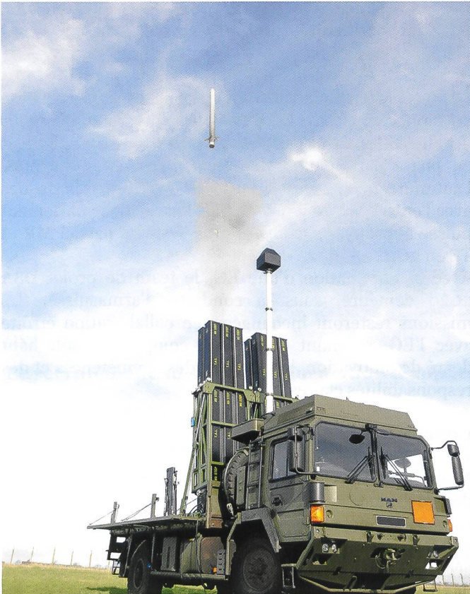
SPYDER-MR de la firme Rafael ( de g. à d.).