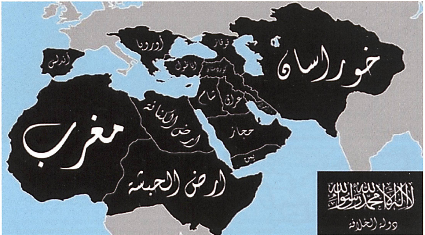
Représentation territoriale phantasmée du Califat de l'État islamique, rassemblant tous les ensembles ayant été sous contrôle islamique pendant une partie de l'histoire.