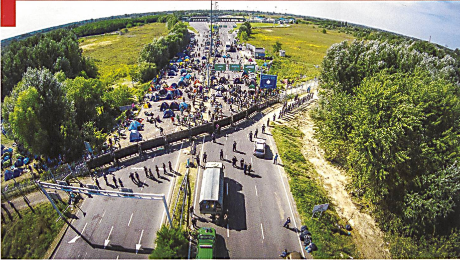
Photographie prise d'un drone à la frontière entre la Serbie et la Hongrie, 16 septembre 2015.