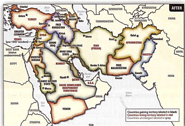
Carte du « Moyen-Orient élargi » par le Lt-col US Ralph Peters, publiée en juin 2006 dans le Armed Forces Journal .

Selon l'orateur, si cette stratégie est dans le meilleur intérêt des Etats-Unis, il n'en va pas de même pour l'Europe. La fragmentation de l'arc sud, à l'origine de migrations massives, est un danger pour la stabilité de l'Europe. Par exemple, l'Algérie, qui achète sa paix sociale avec la rente pétrolière, devrait connaître des troubles prochainement en raison de l'effondrement du prix du baril de brut. La Turquie, qui accueille plus de 2 millions de réfugiés syriens, pourrait décider d'interrompre sa prise en charge de ceux-ci et de les envoyer en Europe.