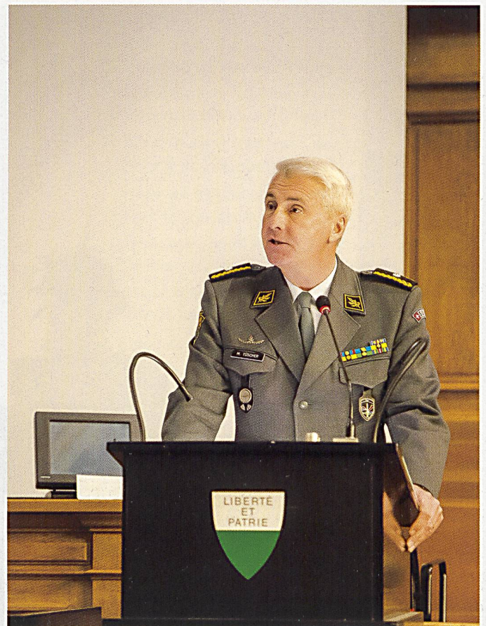
Le brigadier Mathias Tüscher, commandant de la brigade d'infanterie 2.

belles, souvent pleines de souffrances et généralement l'expression de la lutte d'un petit nombre cherchant à s'accaparer les privilèges d'une élite. Ainsi en est-il allé en pays de Vaud, souligne Pierre Streit : « la petite troupe