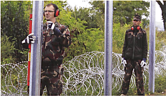
Construction de barrières anti-migrants par l'armée hongroise le long de la frontière croate.