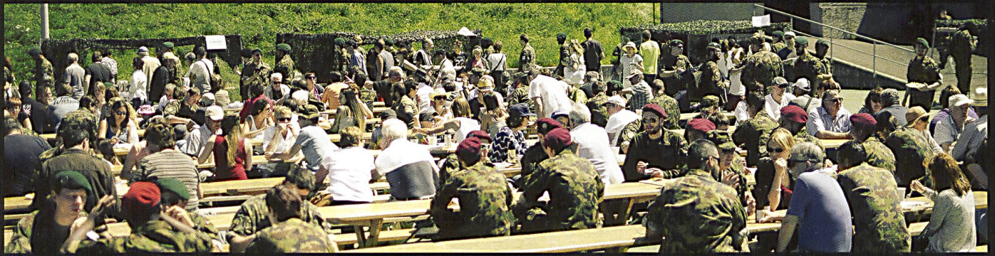
Impressions lors de la journée TON ARMÉE à Aigle, samedi 16 juillet 2016.