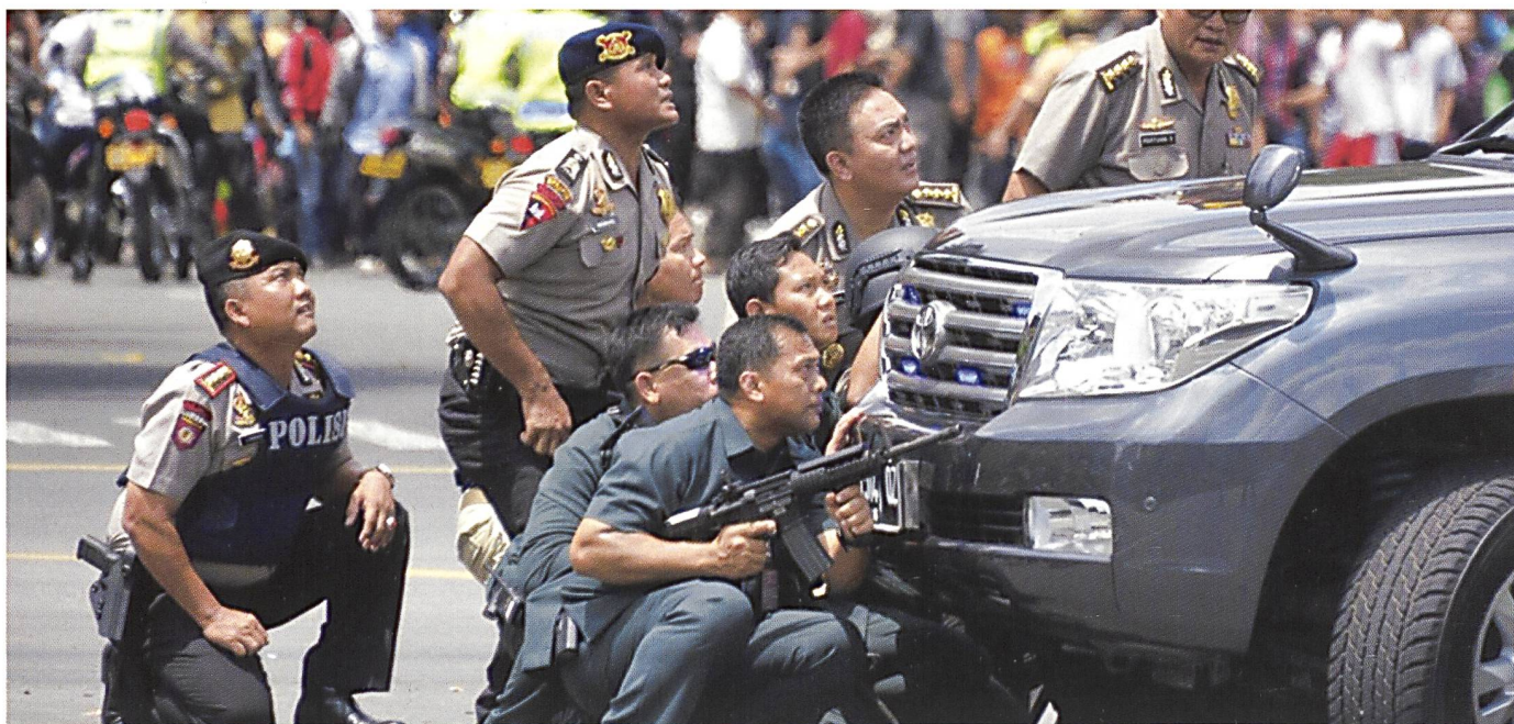
Des membres des forces de sécurité indonésiennes lors du raid urbain de Jakarta, en 2016.