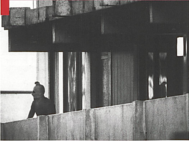
Un terroriste palestinien lors de la prise d'otage aux jeux olympiques de Munich.