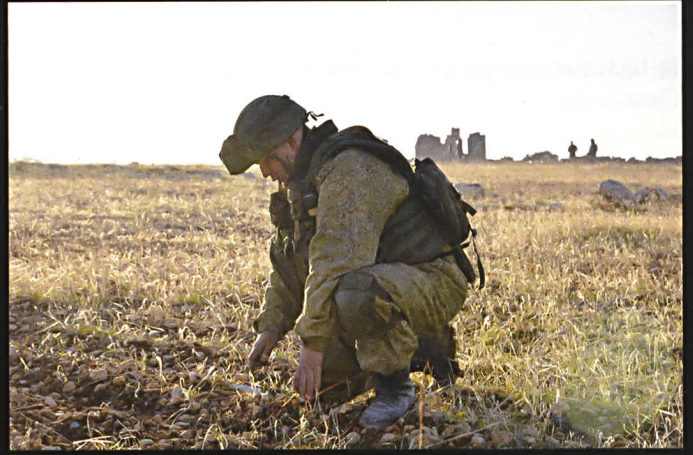
Un démineur russe en opérations, campagne d'Alep.