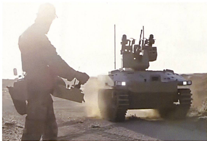
Ci-dessus : Un opérateur à côté d'un Soratnik . Celui-ci est employé en Syrie par les forces spéciales russes.