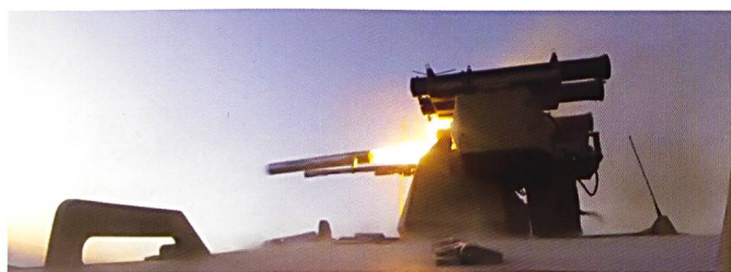
Ci-dessous : Tir d'un missile antichar guidé Kornet par un Soratnik .