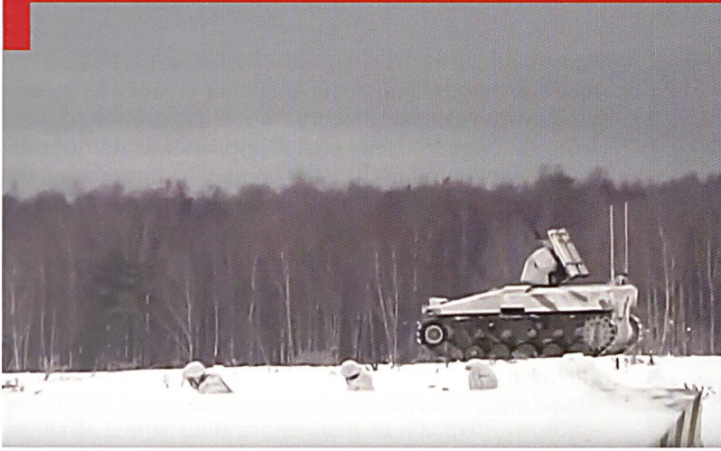
Présentation du drone de combat BAS-01G BM Soratnik au polygone d'Alabino, près de Moscou. Cet engin comprend une mitrailleuse 6P49 Kord (12,7 mm) et 4 missiles antichar guidés 9M133M Kornet-EM (AT-14 Spriggan ).