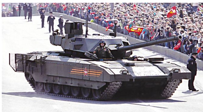
Le T-14 Armata lors de sa première apparition publique, à la parade de la victoire de la grande guerre patriotique à Moscou, le 9 mai 2016.