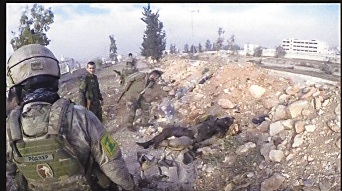
Même si le quartier a été repris aux rebelles, les sapeurs demeurent sur leurs gardes.