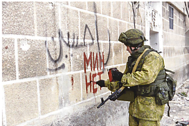
Ci-dessus : Un sapeur russe peint « pas de mines » sur le mur d'une maison à Alep et ci-dessous : Opérations de déminage par un trinôme de sapeurs et avec un chien détecteur de mines.