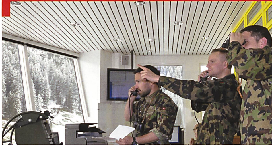
Direction d'un exercice de tir de combat sur la place de tir de Wichlenalp, dans le canton de Glaris.