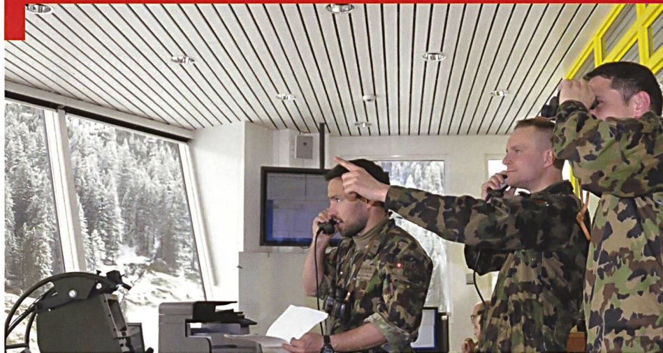
Direction d'un exercice de tir de combat sur la place de tir de Wichlenalp, dans le canton de Glaris.