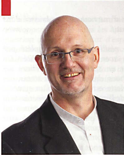
Le colonel Philippe Vallat.