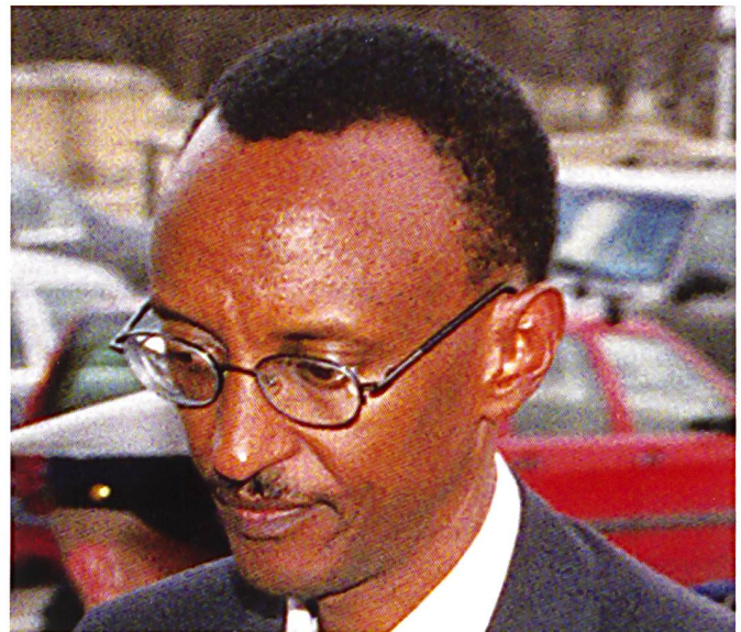
Paul Kagame, actuel président du Rwanda, photographié en 2003.

James Kabarebe, photographié en 2012. Durant la guerre, il dirigea l'artillerie « lourde » de l'APR, constituée notamment de mortiers de 120mm, de LRM Type 63 de 107mm ou encore de canons ZPU de 14.5mm.