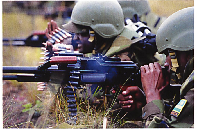
Séance de tir à la mitrailleuse PKM, en 2011. Malgré son étroite collaboration avec les USA, les soldats rwandais continuent d'être équipés d'armes individuelles de conception soviétique.

La NRA n'avait, avec onze bataillons et environ 20'000 hommes en janvier 1986, pas la taille voulue pour faire face au défi et se lança dans un programme d'expansion accéléré. Elle quintupla ainsi ses effectifs en quelques