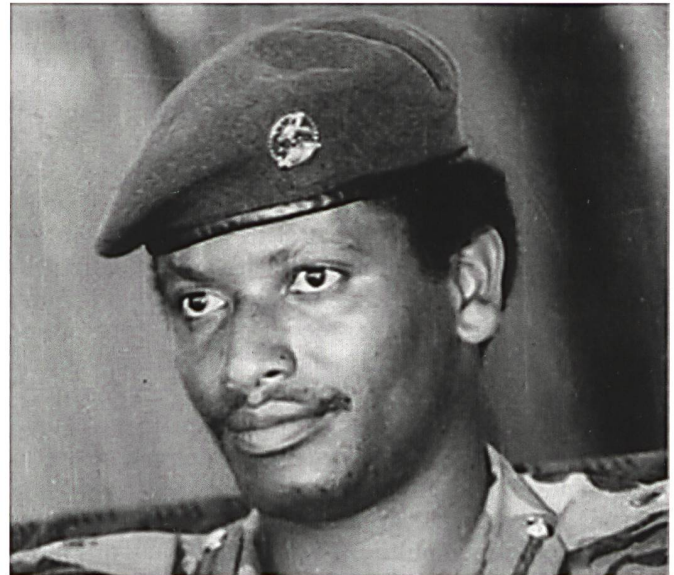
Fred Rwigyema, premier président du FPR et fondateur de l'APR. Il reste universellement décrit comme un homme courageux et charismatique.

L'APR parvint ainsi à prendre l'ascendant sur l'armée rwandaise, qui, malgré un important soutien français, notamment en matière d'entraînement, perdit de sa cohésion. Les FAR étaient en effet entrées dans un cercle vicieux que le corps des officiers, pourtant bien formé, ne parvint pas à inverser. Celui-ci était en effet induit par une crise de croissance – l'armée étaient passé de trois à près de trente bataillons en quelques mois. De plus,