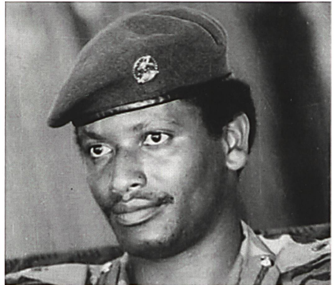
Fred Rwigyema, premier président du FPR et fondateur de l'APR. Il reste universellement décrit comme un homme courageux et charismatique.

L'APR parvint ainsi à prendre l'ascendant sur l'armée rwandaise, qui, malgré un important soutien français, notamment en matière d'entraînement, perdit de sa cohésion. Les FAR étaient en effet entrées dans un cercle vicieux que le corps des officiers, pourtant bien formé, ne parvint pas à inverser. Celui-ci était en effet induit par une crise de croissance – l'armée étaient passé de trois à près de trente bataillons en quelques mois. De plus,