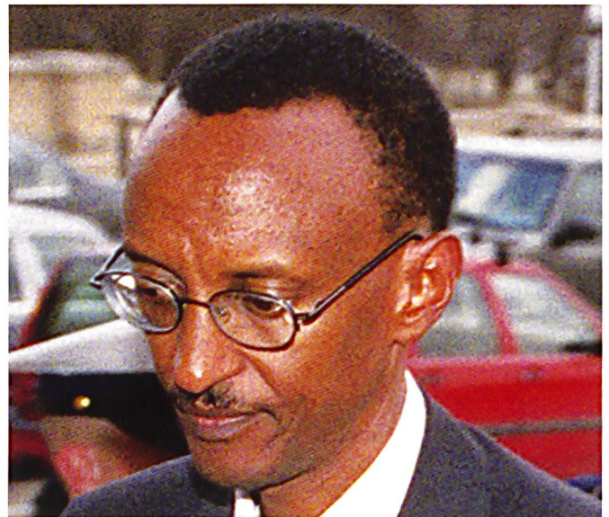
Paul Kagame, actuel président du Rwanda, photographié en 2003.

James Kabarebe, photographié en 2012. Durant la guerre, il dirigea l'artillerie « lourde » de l'APR, constituée notamment de mortiers de 120mm, de LRM Type 63 de 107mm ou encore de canons ZPU de 14.5mm.