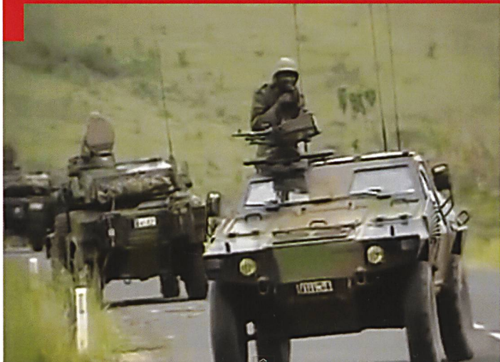
VBL et AML du bataillon de reconnaissance de l'armée rwandaise, photographiés dans le Mutara en octobre 1990.