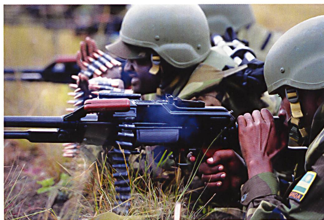
Séance de tir à la mitrailleuse PKM, en 2011. Malgré son étroite collaboration avec les USA, les soldats rwandais continuent d'être équipés d'armes individuelles de conception soviétique.

Paul Kagame en décembre 1993 s'adresse aux hommes du 3e bataillon de l'APR, peu avant que ceux-ci ne partent à Kigali pour y constituer une garnison dans le cadre des accords de paix d'Arusha. Le rôle de cette unité sera déterminant durant la bataille de Kigali en avril 1994.