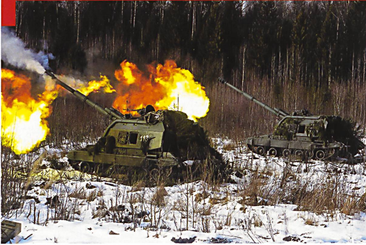
L'obusier 2S19 Msta pèse 42 tonnes. La portée de son canon de 152 mm est de 29 km avec des munitions « base bleed » et 36 km avec des projectiles assistés par fusées (RAP).