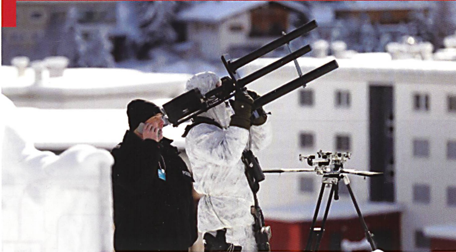
Un brouilleur anti-drones engagé par la police bernoise au World Economic Forum (WEF) à Davos.