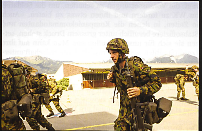
FOXTRAP 13: Exercice de tir avec munitions de combat sur la place de l'Hongrin. Un tel exercice nécessite une organisation poussée et un entraînement précis.