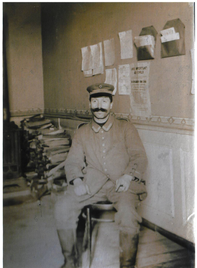
Un déserteur allemand à Porrentruy.