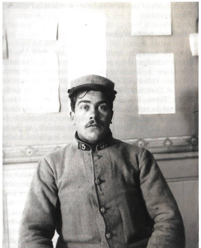
Un déserteur français en Suisse.