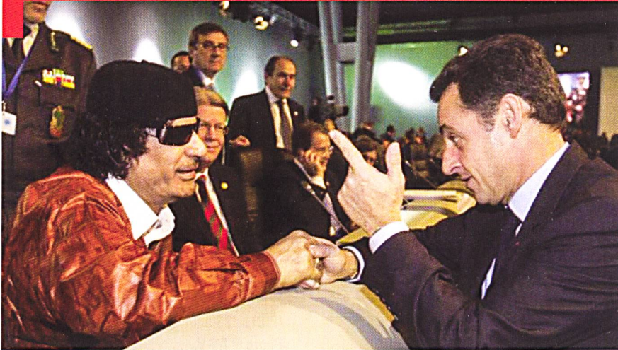
Khalifa Haftar et son Armée nationale libyenne : le maréchal Haftar ancien compagnon d'armes de Mouammar Kadhafi affirme avoir plus de 75'000 hommes contrôlant le sud du pays et les frontières libyennes de l'Égypte à la Tunisie.