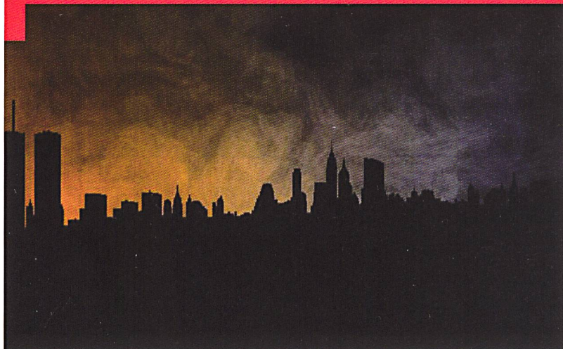
Les effets du blackout de 1977 sur l'éclairage de la ville de New York.