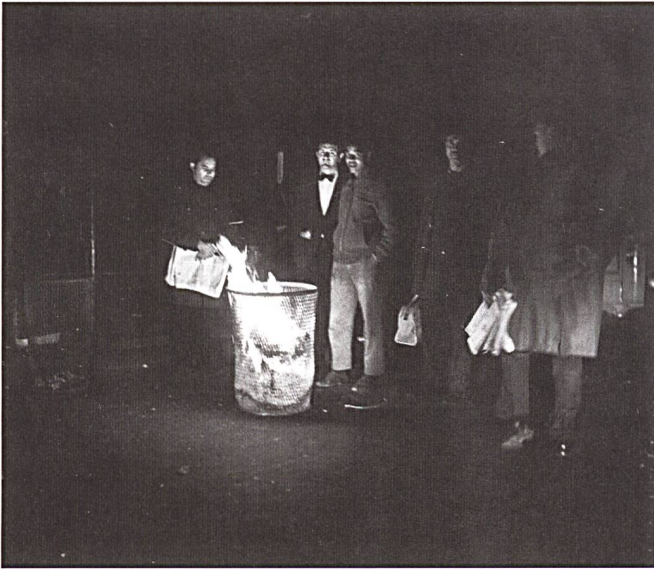
Pour ceux qui ne peuvent pas rentrer chez eux, s'éclairer et se chauffer devient nécessaire. Ici, un groupe d'hommes brûle des journaux dans une poubelle lors de la nuit soirée du blackout de New York en 1965.

secours, les médicaments réfrigérés se réchauffent et deviennent inutilisables. Les clients nécessitant ces médicaments sont redirigés vers les hôpitaux. La situation des hôpitaux devient délicate. Dans les maisons de retraite, la température peut devenir dangereuse pour les résidents. Cette situation nécessite de transférer une partie des patients dans les hôpitaux ou de les confier à leurs familles.