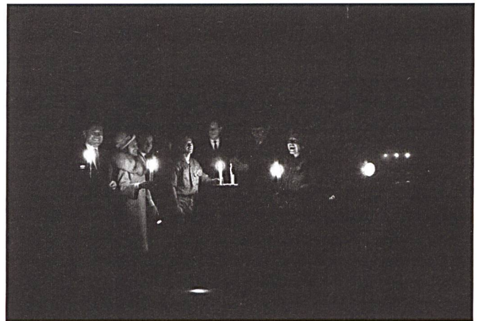
Eclairage aux chandelles la soirée du blackout de New York en 1965. L'ambiance est à ce stade décontractée et amusée.

Dans le secteur bancaire, les agences qui avaient pu demeurer ouvertes continuent de fonctionner. En fonction des circonstances, certains établissements sont exploités sous la protection de la police. Le retrait d'argent aux guichets est toujours possible, même si les files d'attente s'allongent. Pour les individus ne pouvant se rendre en agence, le manque d'argent liquide commence à poser des problèmes.