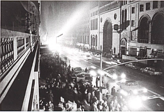
Les artères de la ville de New York après la soirée du blackout de 1965. La ville demeure animée et ordonnée et plusieurs centaines de milliers de personnes rentrent chez elles à pied.

les pompes des stations essence ne fonctionnent plus et un nombre croissant d'automobilistes sont immobilisés en conséquence. Les passagers des transports publics sont soit bloqués, soit mis en retard. En fonction de la présence ou non de tunnels sur les tronçons, les autoroutes peuvent être fermées. En effet, l'absence de ventilation et d'éclairage dans les tunnels conduit à leur fermeture pour des raisons de sécurité. Cette fermeture rallonge les trajets et temps de parcours. Le trafic ferroviaire est également immédiatement touché. 7 La grande majorité, voire la totalité des trains s'arrête (en fonction de la prévalence des locomotives diesel). Si, lors de l'interruption de courant, certains trains sont en gare, d'autres se retrouvent à l'arrêt dans des tunnels ou des tronçons ouverts. Très rapidement, l'ensemble du trafic restant doit cesser pour raisons d'encombrement ou de sécurité.