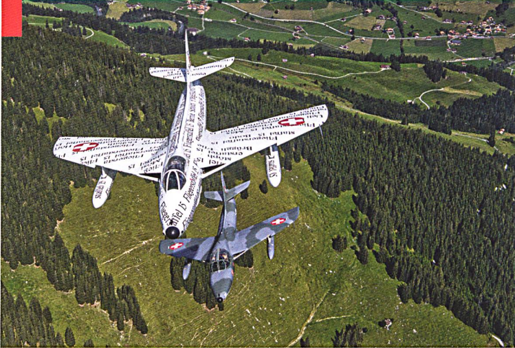
Un vol au-dessus des Alpes bernoises, qui rappelle avec nostalgie les années 1970.