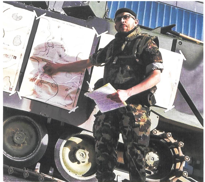
Chef de section chez les grenadiers de chars (en haut) ou chez les explorateurs (en bas) est une fonction exigeante, en tant que planificateur, instructeur et enfin en tant que chef responsable.