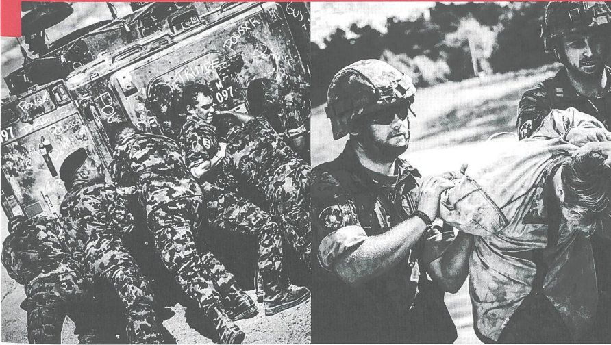
Toutes les photos © Bat chars 18 durant le cours de répétition 2016, à Bure.