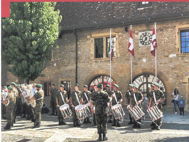
La partie officielle a eu lieu dans la cour du château.