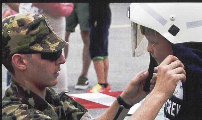
Impressions dans le château de Colombier. La police neuchâteloise et les spécialistes de montagne de l'armée accueillent un public nombreux et curieux.