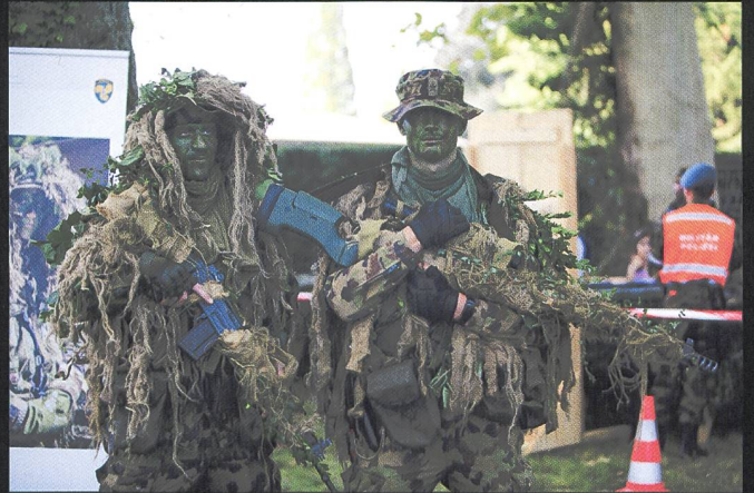
L'Ecole d'infanterie 2 a présenté ses moyens mais également ses techniques d'intervention devant un public très nombreux.