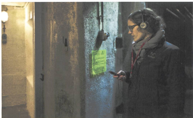
Avec le guide audio-visuel à travers l'exposition.

Exposition: La forteresse de Fürigen de 1941 à nos jours - Etat d'urgence et vie quotidienne à l'intérieur de la montagne