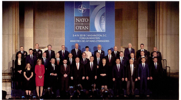
Stoltenberg, NATO, 2019: "We went into Afghanistan together, and we agree that we will take any decisions on our future presence together"