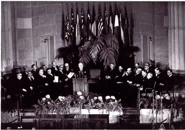
Lord Ismay, NATO, 1957: "Keep the Russians out, the Americans in, and the Germans down"