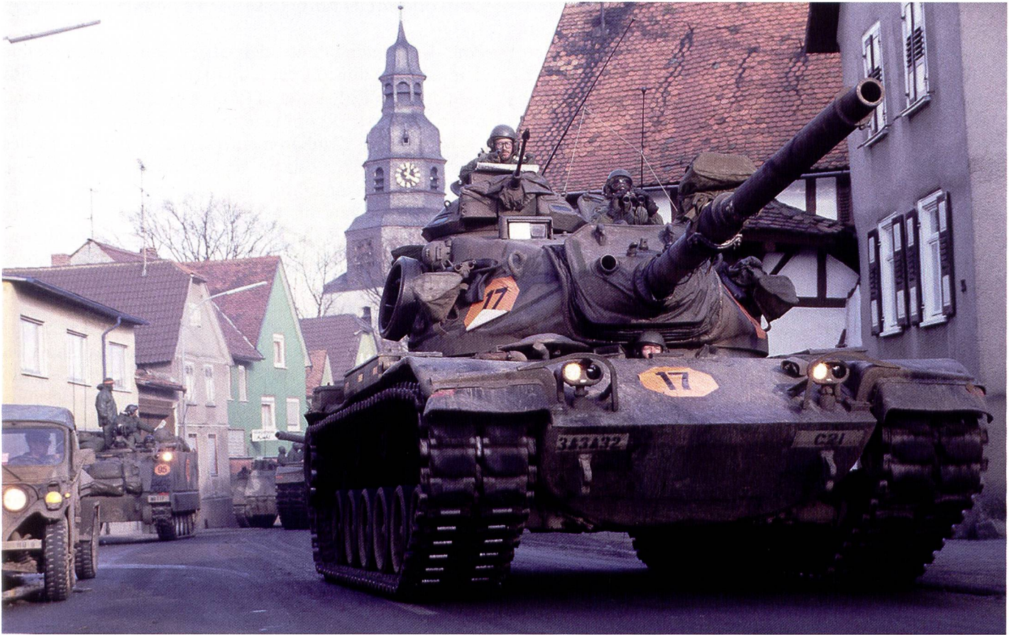
Un char américain M60A3 en manoeuvres au nord-est de Francfort (trouée de Fulda) lors de l'exercice CENTRAL GUARDIAN, l'une des phases de REFORGER 85.

loin que celles plus fréquentes de « défense européenne » ou de « politique européenne de sécurité et de défense commune » (PESDC). A ses yeux, il ne s'agit plus de simplement coordonner, mais d'intégrer, voire d'unifier. De son côté, 13 novembre 2018, la chancelière allemande a déjà utilisé l'expression devant le Parlement européen. L'histoire de la CED semble se répéter, même si l'impulsion est française et si elle survient dans un contexte particulier. En septembre-octobre 2017, Paris a fait une série de propositions pour relancer la PESDC, avec l'établissement entre 23 pays – et pas un noyau dur comme le voulait Paris – d'une « coopération structurée permanente » (PESCO 2 ), la création d'un « Fonds européen de défense » 3 , une « Initiative européenne d'intervention » pour les opérations à l'étranger et un appel à une « culture stratégique partagée » (échanges d'officiers dans les états-majors et les académies militaires) qui fait écho au traité franco-allemand de 1963. Berlin se refuse toujours à accepter la création d'un « quartier général européen commun ». Or sans capacités propres de planification et de commandement, difficile de parler d'une quelconque « autonomie stratégique » de l'Europe,