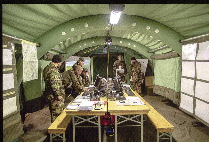
Ci-dessous : Prise de l'étendard du bataillon d'état-major. A droite et ci-dessous : L'exercice GROTTO a permis d'entraîner les «bascules» entre l'échelon avancé de commandement (EAVC) et le poste de commandement mobile (PC mob), généralement installé dans une infrastructure protégée.