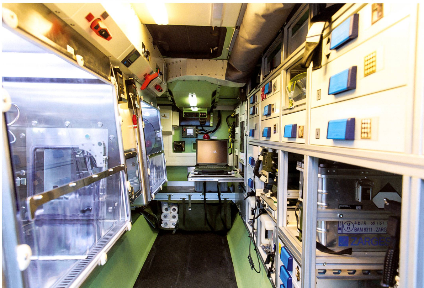
Laboratoire mobile (véhicule de détection mobile).

Dans le cadre de la maîtrise des incidents radiologiques et nucléaires, la défense NBC n'est pas la seule susceptible de fournir des prestations spécialisées. Le Conseil