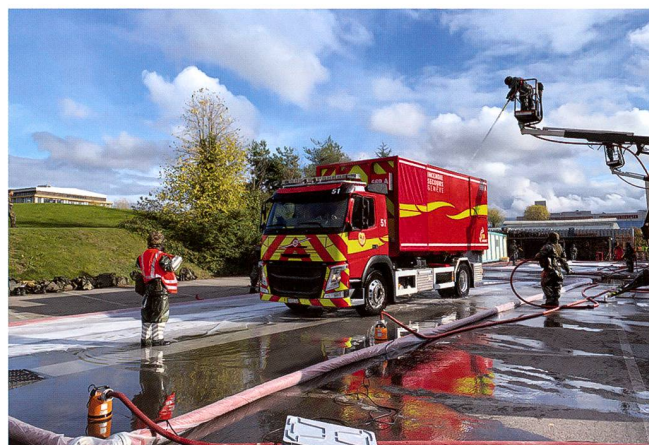
Décontamination de véhicules.

Une autre prestation essentielle de la défense NBC serait la décontamination approfondie. Les sections de décontamination sont organisées autour de modules spécifiques pour la décontamination de personnes, de patients valides ou invalides, de véhicules ou de matériel. Ces dernières années, les intervenants civils se sont préparés et équipés pour la décontamination de personnes (ou décontamination de masse) et de patients (désignation d'hôpitaux de décontamination par les cantons) mais la décontamination de véhicules et d'équipements reste sous cette forme une prestation presque exclusive de l'Armée.