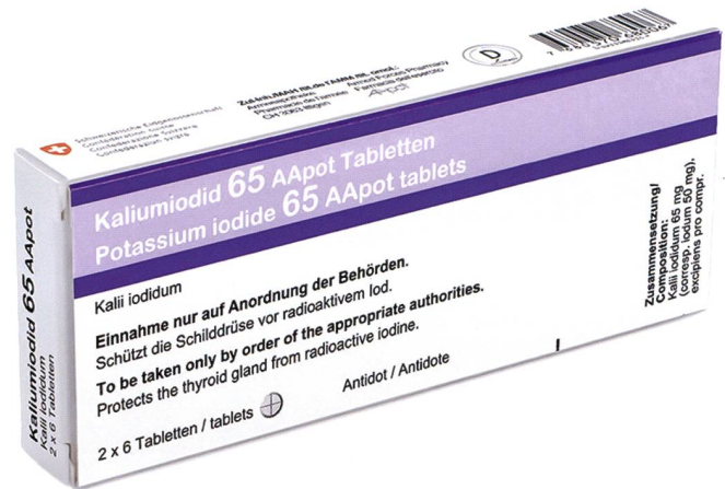
Comprimés d'iode.