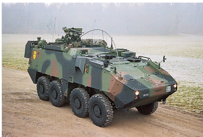
Véhicule d'exploration NBC.