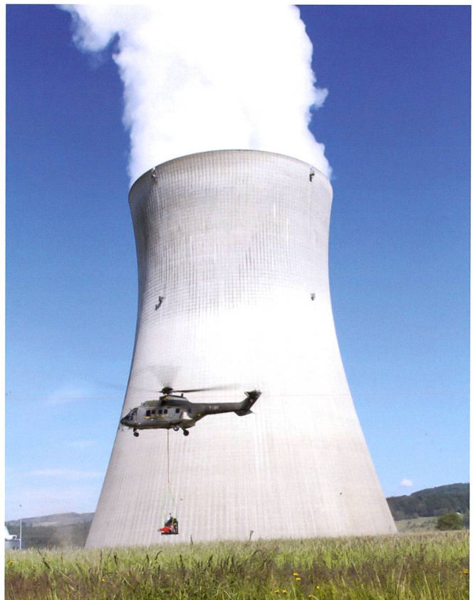
Transport hélicoptère depuis l'entrepôt de Reitnau (photo © Inspection fédérale de la sécurité nucléaire IFSN).

Si en revanche, nous n'intervenons plus pour les crises de basse intensité en ne travaillant plus que sur l'exceptionnel, nous prendrions le risque de nous entraîner toute notre vie pour quelque chose sur lequel nous ne serions jamais éprouvés : ce serait alors le syndrome du Désert des Tartares qui nous guetterait... Amaury de Hauteclouque, Chef du Raid 2 2007-2013