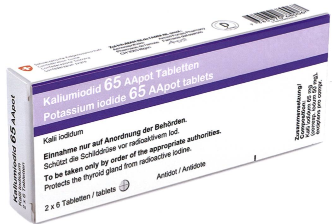
Comprimés d'iode.