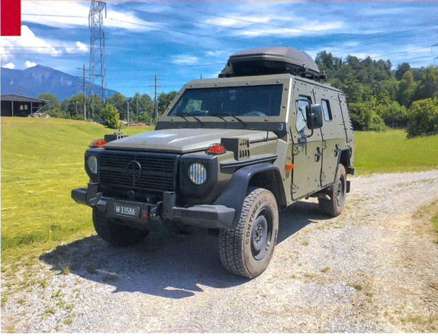
Ci-contre, à gauche : Véhicule de radiométrie.