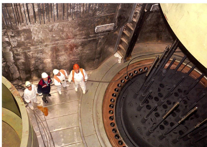
Ci-dessous : Réacteur d'une centrale nucléaire.