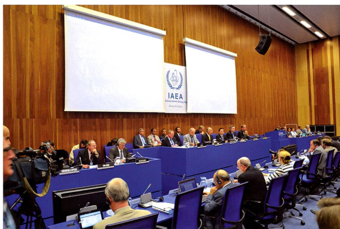
Ci-dessus : 2 e réunion extraordinaire des parties contractantes à la Convention sur la sûreté nucléaire. AIEA. Vienne. 2012.