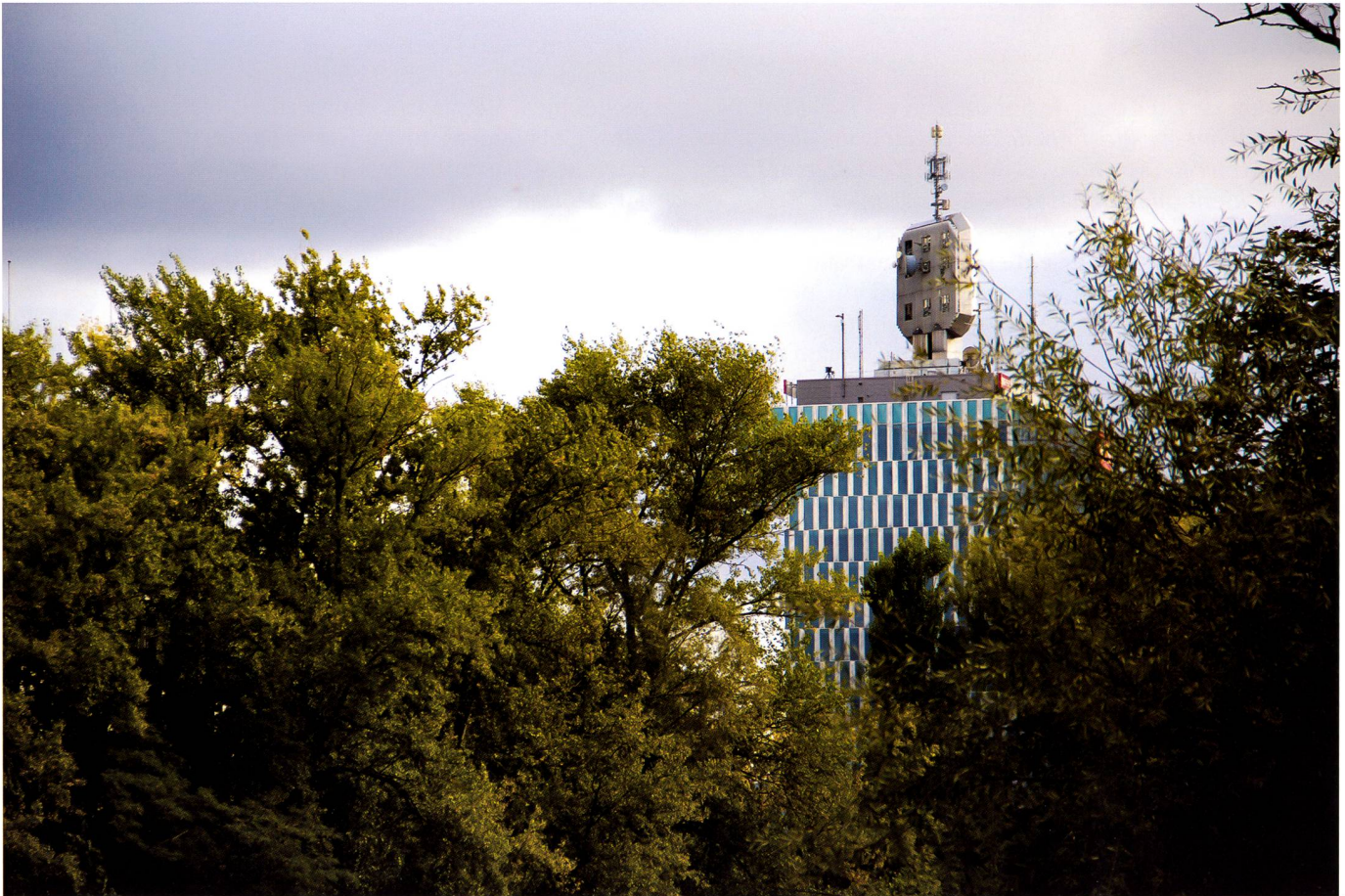
LUX passait par Genève. Ici le sommet de la tour RTS, en pleine ville, prise d'assaut par les R-905 du bat ondi 16.