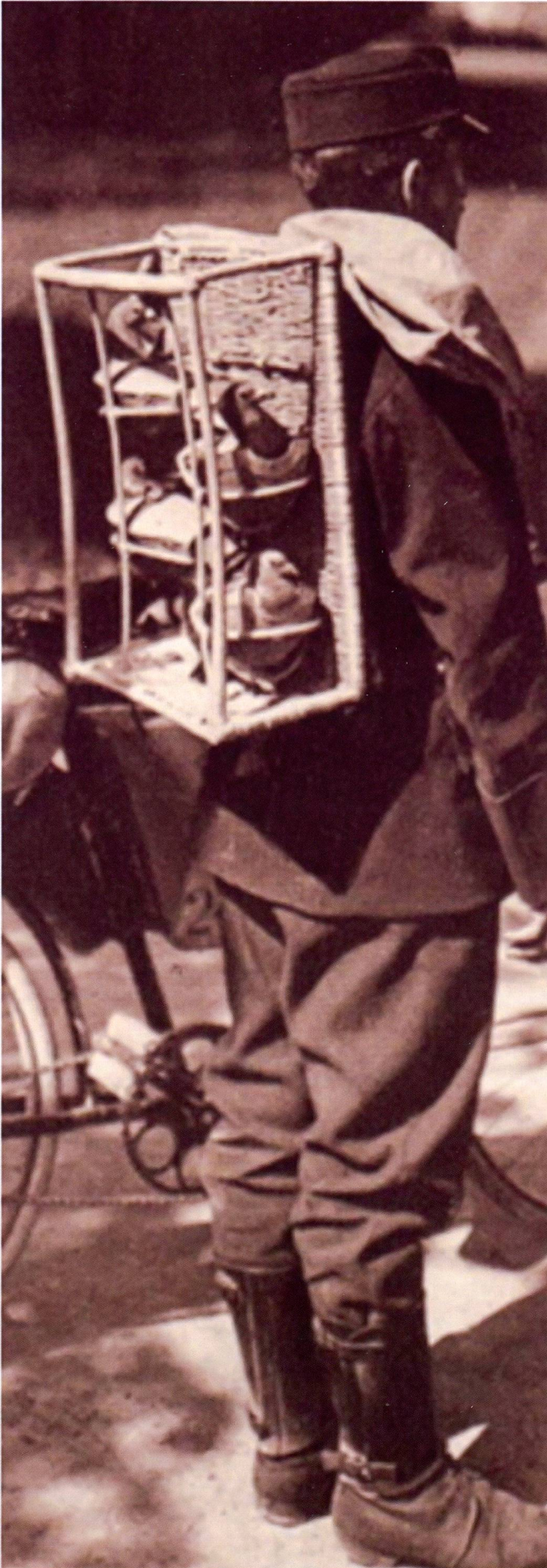
Les agents de transmission cyclistes porteurs de pigeons voyageur, pionniers des transmissions de l'armée Suisse, 1929.

et légères que les R-916, qui permettent un plus grand débit (8MBit/s) et offrent des liaisons protégées contre l'écoute clandestine. Ces R-905 sont encore en service aujourd'hui. Ce sont même l'un des moyens de base d'une troupe d'ondes dirigées comme le bat ondi 16. Et si les antennes ont subi quelques mises à jour depuis leur version de 1996, comme l'ajout de fibre optique, permettant dès lors de disposer les antennes jusqu'à 4 kilomètres du commutateur ou encore une augmentation du débit, la base reste sensiblement la même.