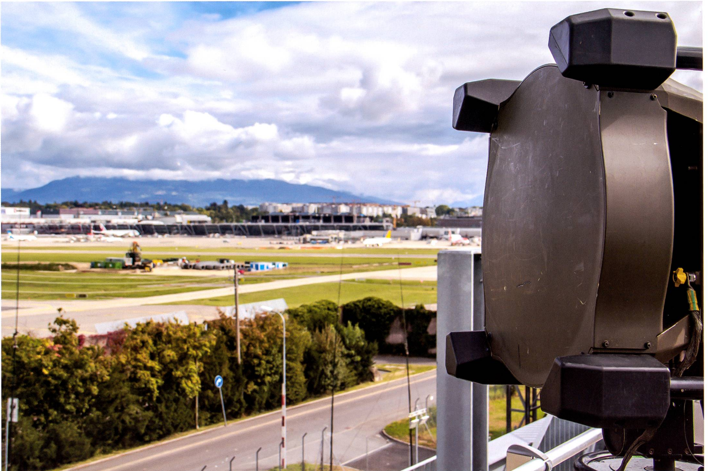
Aux abords de l'Aéroport international de Genève, le bat ondi 16 assurait aussi les télécommunications pour les formations engagées dans LUX.