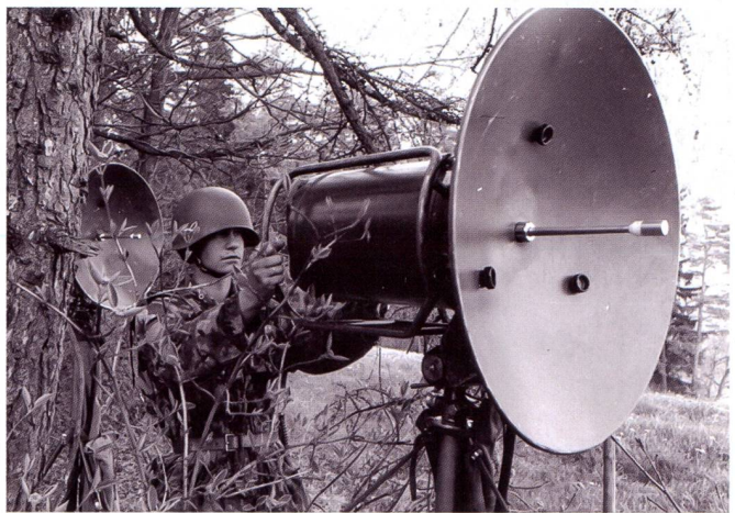
Sur le terrain, les R-902 étaient appréciées de la troupe.

devait pouvoir s'adapter, sans que les délais d'installation et de connections des différents emplacements ne nuise au bon fonctionnement de la mission des troupes sur le terrain. »