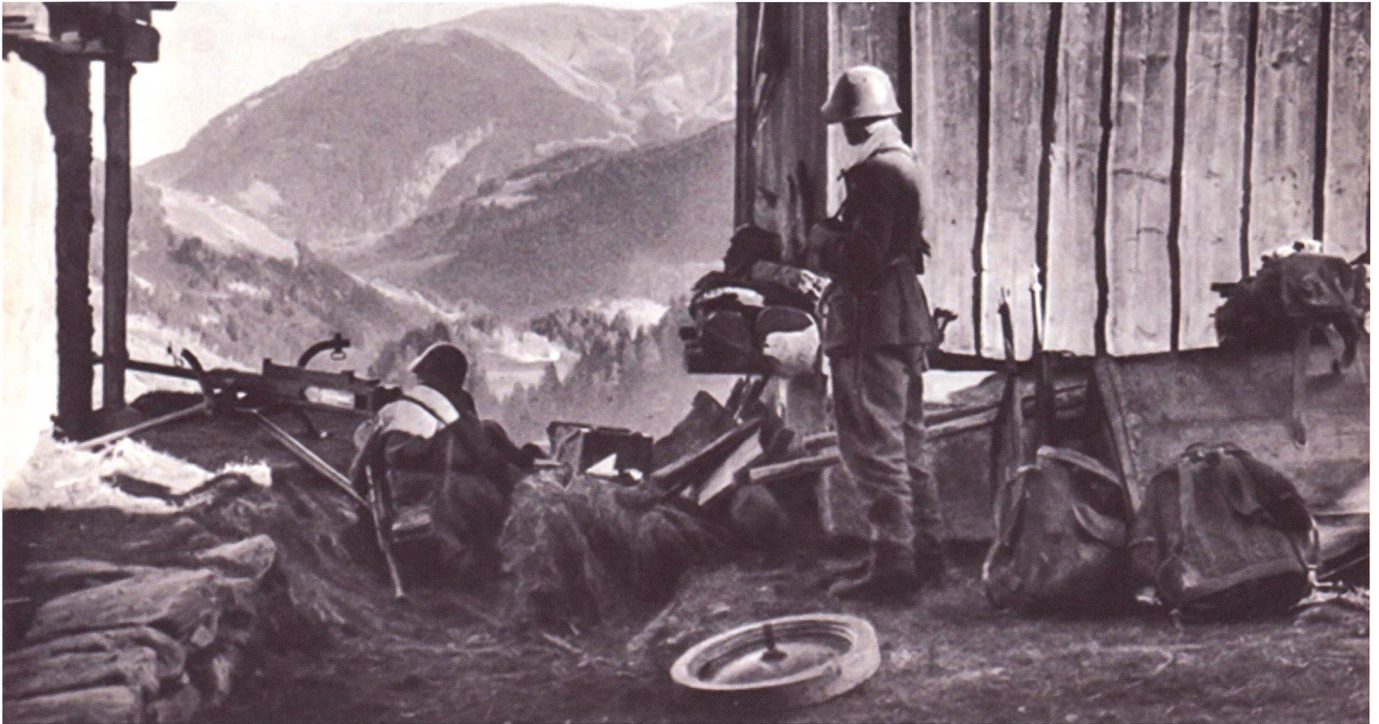
Une arqueeuse 1941 dans sa position de feu, en montagne.

occidentale du Reich n'était couverte essentiellement que par des unités défensives. Le commandement des forces militaires alliées françaises et britanniques aurait pu, dans cette phase de la guerre, tenter une grande offensive d'enveloppement. Mais on n'assista qu'à des engagements sans importance sur les avants de la « ligne Siegfried » et aucune action sur les flancs ou les arrières de ce dispositif de défense – en le contournant par le nord ou par le sud – ne fut entreprise. La condition préalable à un mouvement de ce genre eut été la violation des territoires neutres. Mais la Suisse aussi bien que la Belgique et les Pays-Bas resta en dehors des opérations militaires. Sur les hauteurs du Jura comme à nos autres frontières, l'armée suisse était prête à faire face à toute invasion. La situation devint beaucoup plus critique pendant l'été 1940. » 20