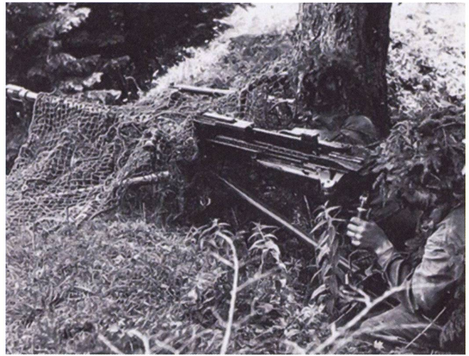
L'arquebuse 41 tire des obus de 20 mm à une distance pouvant dépasser 1'000 mètres. Mais en 1941 elle est déjà largement dépassée en tant qu'arme antichar.

A propos de la défense du territoire Suisse, dans le chapitre de son rapport consacré aux fortifications et destructions, le Général Guisan met aussi en évidence le fait qu'en septembre 1939, les éléments de fortifications existants « ne répondaient pas à une conception d'ensemble, qu'ils