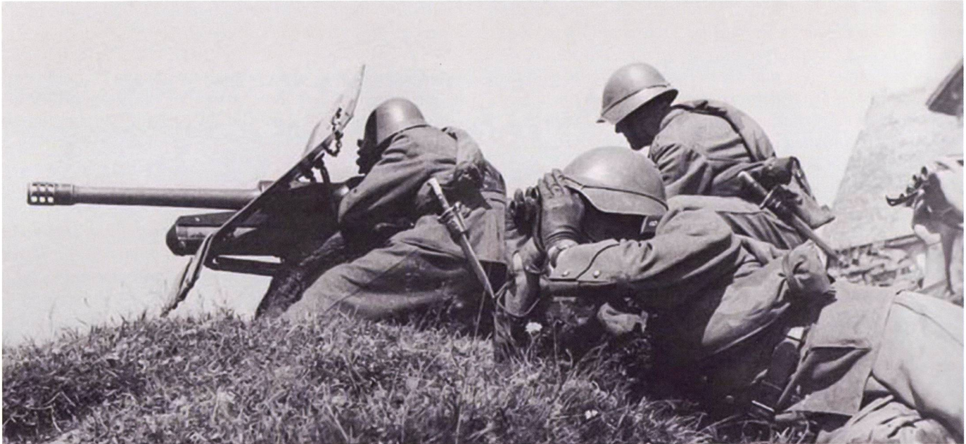
Le canon d'infanterie 4,7 cm modèle 1936 est produit à plus d'un millier d'unités et sert massivement dans l'armée suisse au cours de la Seconde Guerre mondiale.