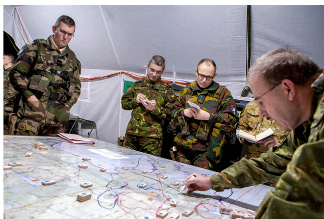
Les forces de l'OTAN s'articulent en « groupements de combat » bataillonnaires multinationaux.

L'Europe paie cash aujourd'hui trois décennies de pressions budgétaires et d'angélisme post-guerre froide. Cette situation a conduit l'OTAN, lors du Sommet du Pays de Galle en 2014, à affecter à travers ses membres au moins 20% des dépenses globales à la recherche, au développement et à l'acquisition d'équipements majeurs. Dans la mesure où ces dépenses sont coordonnées à travers des accords de normalisation, 14 leur effet de levier est conséquent.