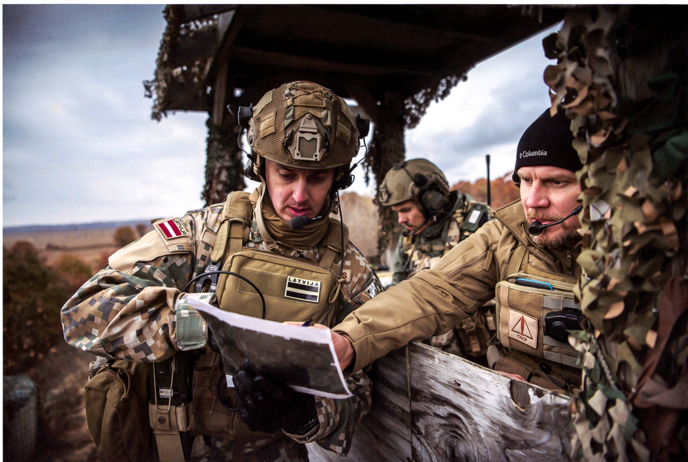
Des manoeuvres se succèdent chaque mois dans les États baltes (ici en Lettonie) ainsi qu'en Pologne, en Allemagne et en Scandinavie.

l'OTAN et s'affirme sur la protection des infrastructures critiques, la réponse aux catastrophes naturelles, la lutte anti-terroriste et les opérations humanitaires. Le Comité de Diplomatie Publique œuvre à une perception positive de l'OTAN, en phase avec ses objectifs.