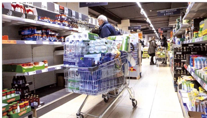
Comportement d'accaparement dans des supers marchés, français ou suisse.

de thésaurisation, ainsi que quelques violences entre des consommateurs. Ces derniers, tels des automates, sont poussés à acheter compulsivement en prévision d'une hypothétique pénurie largement démentie par les autorités et les distributeurs. Finalement, nous remarquons également des rumeurs alimentées par la peur, la défiance aux autorités et la méfiance des médias, le tout relayé par ce puissant vecteur qu'est l'Internet et particulièrement les réseaux sociaux.