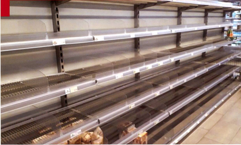
Images de rayons vides dans la grande distribution en Suisse. Nous notons également une préférence pour les produits indigènes et une forme d'évitement pour ceux provenant d'Italie, foyer actif de la pandémie en mars 2020.