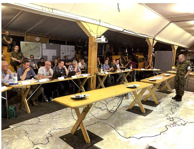
Planification et conduite de l'action.

des anciennes organisations (Arsenaux, PAA, CGF) n'a pas été jeté aux oubliettes. Au contraire, il a servi de base solide pour assurer la logistique d'aujourd'hui avec un haut niveau opérationnel.