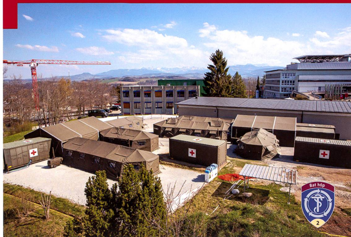
Poste sanitaire à proximité de l'hôpital de Fribourg.