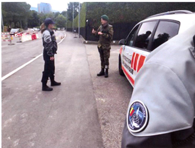
Contacts et échanges d'informations entre une patrouille d'ASP et les militaires en faction devant des missions nécessitant des mesures de sécurisation.

Le lundi 18 mai 2020, un premier désengagement partiel de l'armée sur le dispositif AMBA CENTRO a eu lieu et, depuis le 17 juin 2020, la police internationale a repris l'entièreté des missions AMBA CENTRO, avec la démobilisation complète de l'armée.