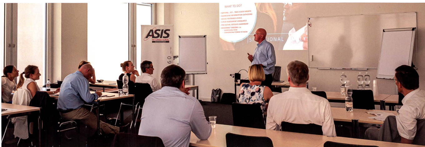
Cours ASIS dispensé en présentiel.

souvent sur l'obtention de certifications sécuritaires internationalement reconnues. Certaines de ces initiatives d'enseignement et de formation sont proposées dans le cadre de programmes de très hauts niveaux sous l'égide d'universités prestigieuses. A relever la possibilité offerte par la Fondation ASIS de bénéficier de bourse de soutien dans le cadre de projets de recherche pratique ou de formations académiques. Par exemple, construit sur le principe de l'exemplarité, le centre de leadership et de développement des CSOs ( Chief Security Officers ) est un forum exclusif de réseautage et de collaboration entre de hauts responsables de sécurité des grandes entreprises, lequel vise à souligner les évolutions des métiers de la sécurité, les attentes et les besoins correspondantes des professionnels.