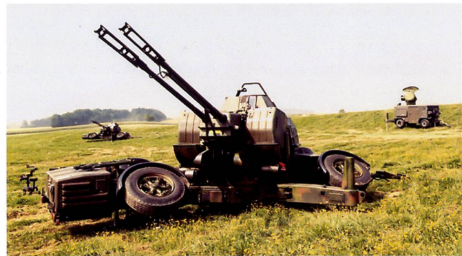
Ci-dessus : Le canon de DCA 63/90 et le système Skyguard n'a pas été délégué aux Grandes Unités des Forces terrestres. Il est destiné à protéger des objets de haute valeur et des infrastructures critiques. Ci-dessous : Le radar ALERT permet d'augmenter sensiblement l'efficacité et la durabilité des formations Stinger .