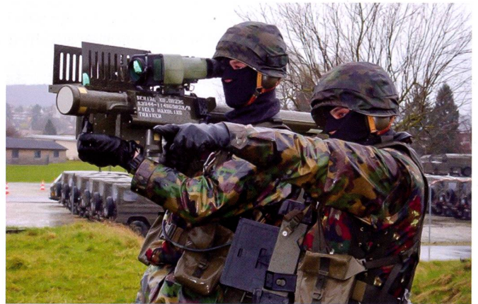
Cours de répétition du groupe engins guidés légers DCA 1 au sein de la brigade blindée 1. Engagement des unités de feu Stinger .