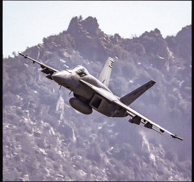
Les quatre appareils en lice pour maintenir la capacité d'intervention dans les airs de l'armée suisse au-delà de 2030 : l'Eurofighter Typhoon , le Boeing F/A-18 E/F, le F-35 Lightning II et le Dassault Rafale .