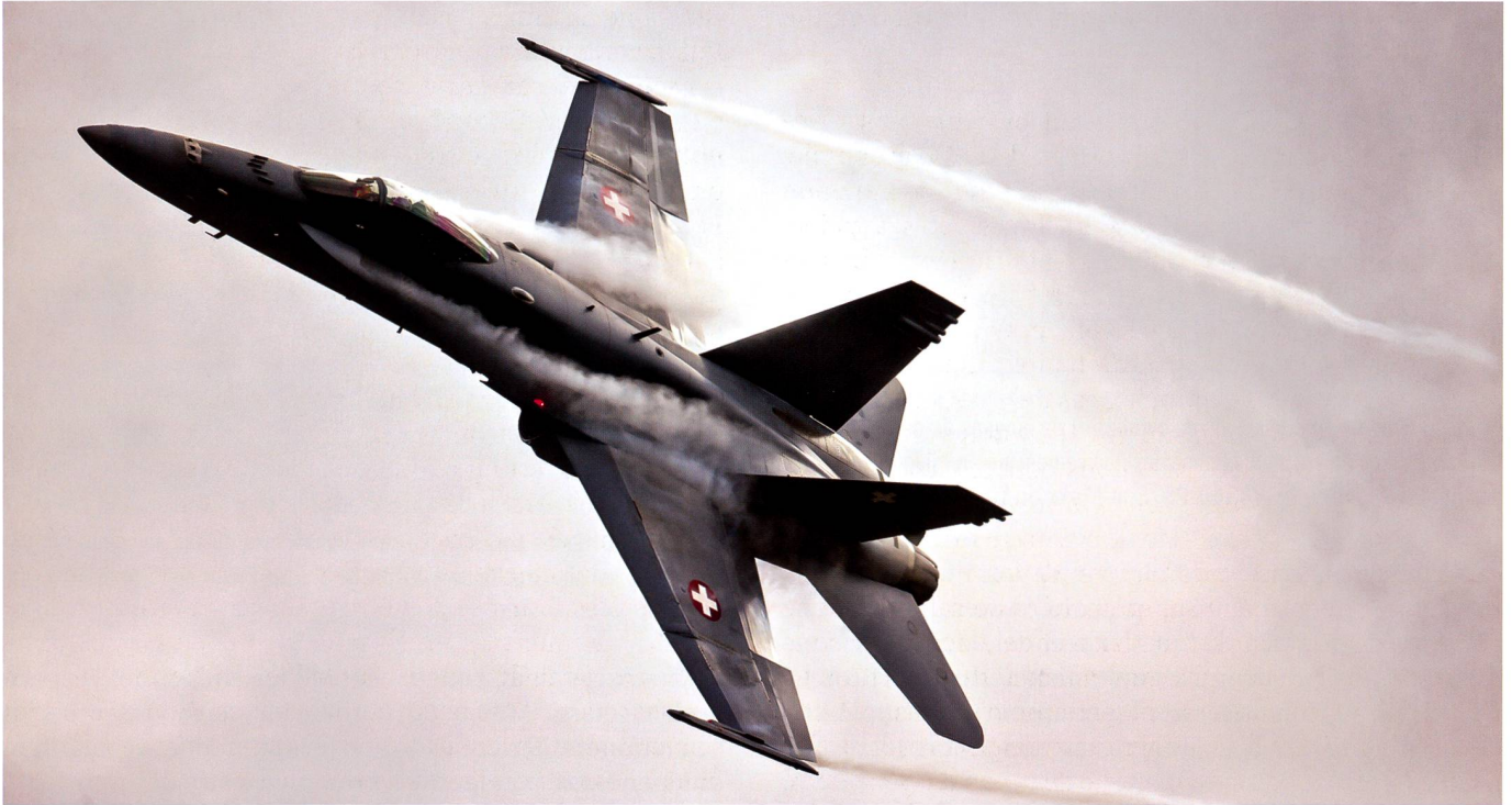
F/A-18 Hornet : les avions de combat sont un investissement à long terme pour la sécurité de la Suisse et de sa population.

Afin de protéger la Suisse rapidement, de manière efficace et effective contre les menaces aériennes en cas de crise, il n'existe actuellement aucune alternative appropriée aux avions de combat. L'utilisation exclusive de drones, d'hélicoptères de combat ou d'avions d'entraînement armés ne convient ni à la police aérienne ni à la défense aérienne. Ces aéronefs sont trop peu performants pour combattre avec succès un adversaire équipé de façon moderne : Les drones sont efficaces dans la reconnaissance aérienne ou pour effectuer des frappes sur des objectifs au sol mais ne conviennent ni à la police aérienne ni à la défense contre les avions de chasse ou les missiles de croisière. Bien que les hélicoptères de combat puissent appuyer les forces terrestres, ils sont trop lents pour la police aérienne ou la défense aérienne et ne peuvent pas voler suffisamment haut. Il n'y a pas non plus d'avions d'entraînement actuellement disponibles sur le marché qui répondraient déjà aux exigences minimales pour le service de police aérienne : selon le type, ils leur manquent la capacité de voler à des vitesses supersoniques, la capacité d'accélération ou ascensionnelle, des capteurs performants (par exemple un radar) ou un armement approprié. Les avions d'entraînement armés ne seraient en outre pas en mesure d'intercepter à temps les avions hostiles et encore moins de les combattre.