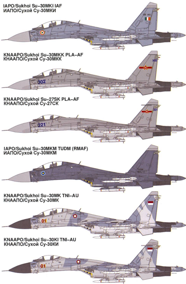
Les Su-30 dans leurs différentes versions présentes sur le théâtre asiatique.

jusqu'au secteur de combat. Pour éviter de retomber dans le piège du tout technologique, il recommande également des ruses de guerre pour être tenu informé, comme le fait de maintenir des observateurs équipés uniquement de téléphones mobiles et utilisant un langage basé sur la carte de commande de McDonald's pour dire combien de « Big Mac » ou de « Nuggets » décollent d'une base donnée, élément qui peut être complété par des navires d'écoute électronique, qui peuvent être camouflés en navires civils, le long du chemin envisagé par les appareils.