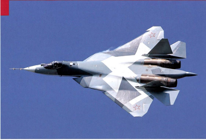
Sukhoi Su-57, peut-être le futur adversaire standard des F-35 et Superhornet