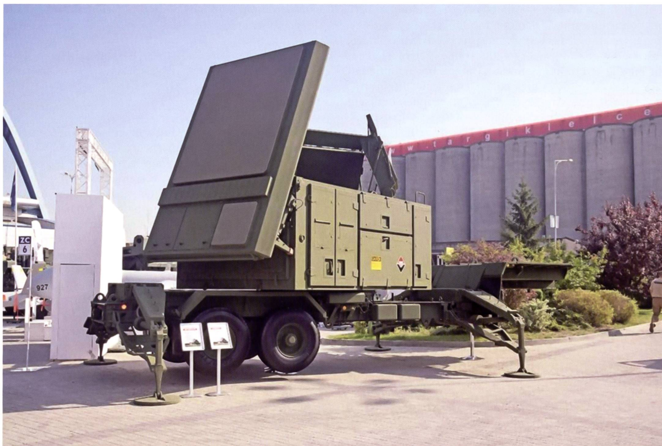
Le nouveaux radar AN/MPQ-65.