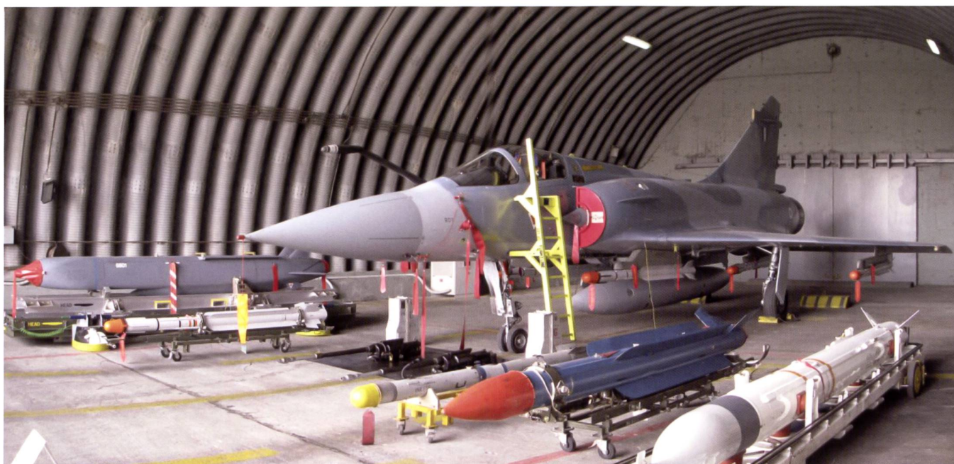
Un Mirage 2000-5 et l'ensemble des armements qu'il peut emporter.