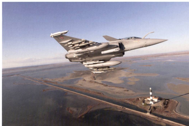
La polyvalence du Rafale et sa gamme étendue de capteurs et d'armements sont adaptés à ces missions et à cet environnement.