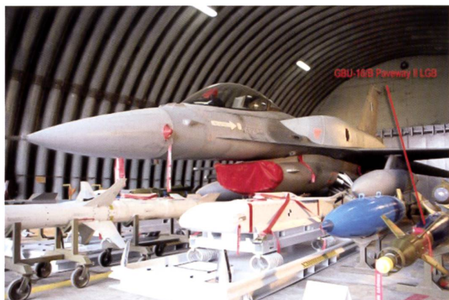
Les F-16 Block 30 et Block 50 sont également en mesure d'emporter une panoplie d'armement diversifiée.

La Grèce possède en outre 170 Léopard 2A6 HEL et 183 A4; les uns comme les autres sont en train de recevoir un système de gestion du champ de bataille C2 baptisé Iniochos .