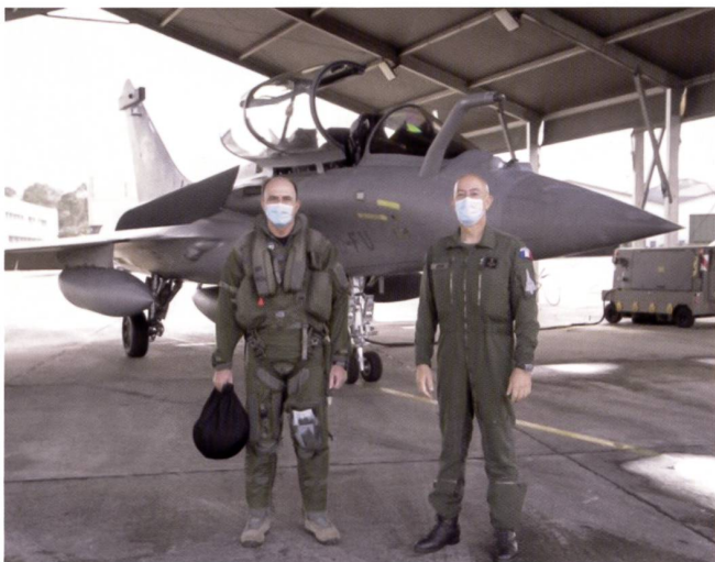
Les deux pilotes d'essais grecs devant le nouveau fleuron des Forces aériennes helléniques.